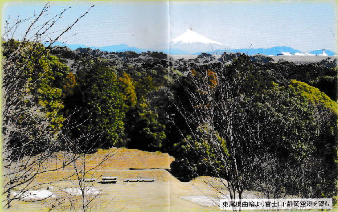
東尾根曲輪より富士山・静岡空港を望む